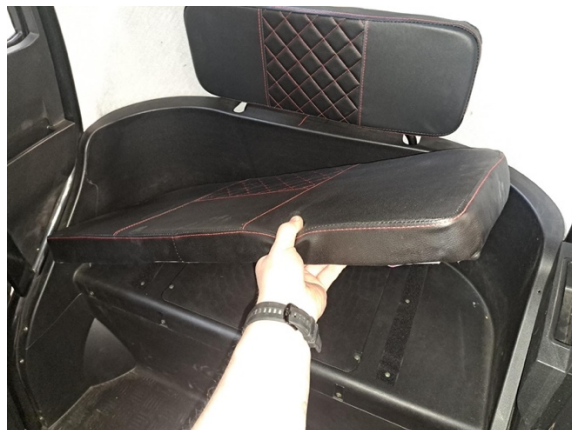
Nosta takaistuin pois. (tarrakiinnitys).