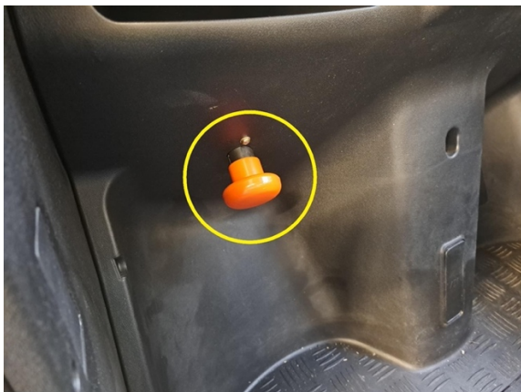
Paina päävirtakyttin kiinni.