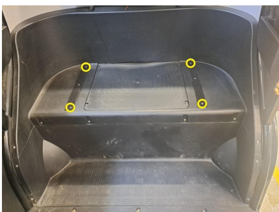
Irrota velcro tarranauhojen reunimaiset kiinnitysruuvit. (ristipäämeisseli ph2).