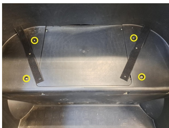
Käännä velcon tarranauhat pois tieltä. Irrota tarranauhojen alta paljastuvat kiinnitysruuvit. (hylsy 8 mm).