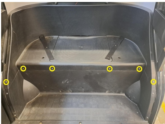
Irrota takaistuimen rungon kiinnitysruuvit. (ristipäämeisseli ph2).