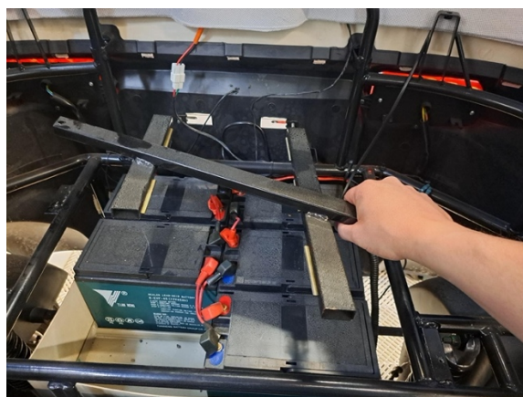
Nosta akkujen kiinnikerauta pois.

Uuden osan asennus käänteisessä järjestyksessä.