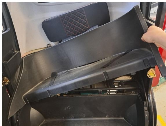
Nosta takaistuimen runko osa pois.